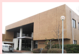
嬉野社会福祉センター