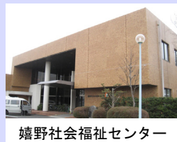
嬉野社会福祉センター